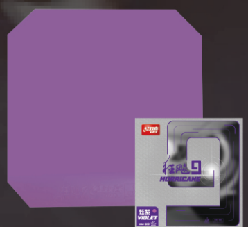
狂飚9-炫紫 粘性胶皮+柔弹海绵