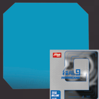
狂飚9-劲蓝 粘性胶皮+经典蓝海绵

1+N，全新彩色粘性套胶 一种配方、四种颜色的粘性胶皮 配置经典22蓝、20橙、80红海绵 演绎多变风格的狂飚9，带来多彩的乒乓运动