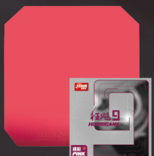
狂飚9-桃粉 粘性胶皮+经典橙海绵