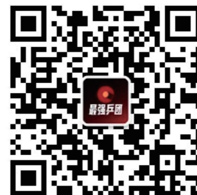
扫描二维码关注 【最强兵团】官方微信公众号