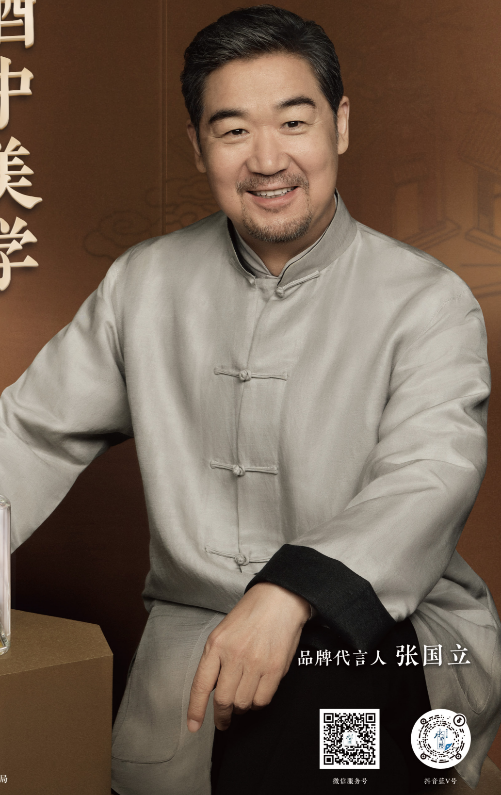
品牌代言人 张国立