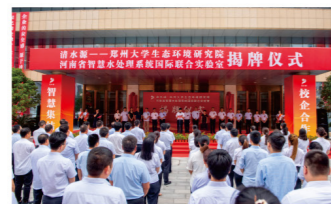
河南省智慧水处理系统国际联合实验室