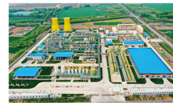
虎岭智能化生产基地