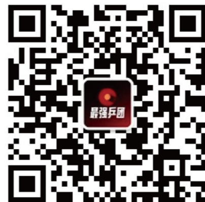
扫描二维码关注 【最强乒团】官方微信公众号