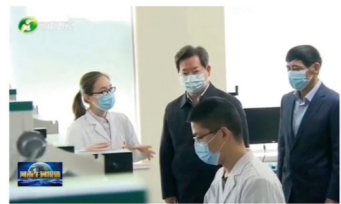
2022年4月7日省委书记楼阳生调研清水源

清水源创建于1995年，总部位于河南济源高新技术产业开发区，是一家专业从事水处理药剂生产与智能化服务的环保科技企业，子公司遍布北京、上海、陕西、河南、海南和美国等地。2015年4月23日在深交所(SZSE)创业板上市。