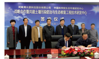
清水源-中科院生态环境研究中心土壤污染防治与生态修复工程技术研发中心

清水源始终秉承“做有益社会、服务全球的百年企业”的核心理念，围绕以工业水为核心的环保产业链创新发展，着力打造工业水处理（药剂研发生产销售、水云踪智能服务、工业复杂废水治理）及生态环保（市政工程村镇生活污水、生态修复河道治理）两大业务板块。同中科院、清华、同济、郑大等院校开展产学研合作，建设具有国际引领示范作用的水处理产品应用及智慧化服务的系统性研究基地，是工信部绿色制造系统解决方案供应商、“清水源-中科院生态环境研究中心土壤污染防治与生态修复工程技术研发中心”、“河南省水处理剂工程技术研究中心”、“河南省智慧水处理系统国际联合实验室”、“清水源-郑州大学生态环境研究院”和“河南省博士后（清水源）创新实践基地”。自主研发了国内首个“水云踪”工业互联网平台，“基于工业互联网架构的水处理智能服务系统”达到同类技术国际先进水平，实现由传统的药剂生产企业向智能化终端服务企业转型和跨越式发展。未来将形成集工业水处理、绿色节能环保、生态环境治理、新能源原料生产、智慧水处理装备制造与数字化服务为一体的现代环保产业集团。