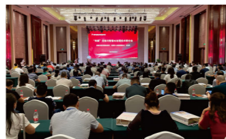
主办2021年“双碳”目标与智慧水处理技术研讨会

清水源始终秉承“做有益社会、服务全球的百年企业”的核心理念，围绕以工业水为核心的环保产业链创新发展，着力打造工业水处理（药剂研发生产销售、水云踪智能服务、工业复杂废水治理）及生态环保（市政工程村镇生活污水、生态修复河道治理）两大业务板块。同中科院、清华、同济、郑大等院校开展产学研合作，建设具有国际引领示范作用的水处理产品应用及智慧化服务的系统性研究基地，是工信部绿色制造系统解决方案供应商、“清水源-中科院生态环境研究中心土壤污染防治与生态修复工程技术研发中心”、“河南省水处理剂工程技术研究中心”、“河南省智慧水处理系统国际联合实验室”、“清水源-郑州大学生态环境研究院”和“河南省博士后（清水源）创新实践基地”。自主研发了国内首个“水云踪”工业互联网平台，“基于工业互联网架构的水处理智能服务系统”达到同类技术国际先进水平，实现由传统的药剂生产企业向智能化终端服务企业转型和跨越式发展。未来将形成集工业水处理、绿色节能环保、生态环境治理、新能源原料生产、智慧水处理装备制造与数字化服务为一体的现代环保产业集团。