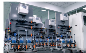
自主研发水云踪智能设备