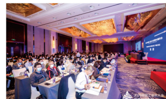
承办2020年中国工业水大会暨第40届年会

清水源是中国化学学会工业水处理专业委员会常务理事单位和全国化学标准化技术委员会水处理剂分会委员单位。作为主要起草单位，清水源先后参与制定了24项国家标准及45项行业标准，获授权专利90余项。研发生产阻垢剂、缓蚀剂、杀菌剂等8大系列、60余种工业循环冷却水处理药剂，畅销全国各个省份，成为国内外水处理知名企业，同时出口美国、俄罗斯、德国、英国、法国、意大利等50余个国家和地区。产品连续获得美国国家卫生基金会NSF认证，6种产品取得欧盟REACH注册，被德国BRENNTAG等知名企业认定为优秀供应商。