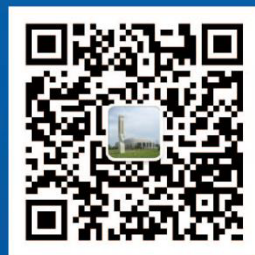
南海国家乒乓球训练基地